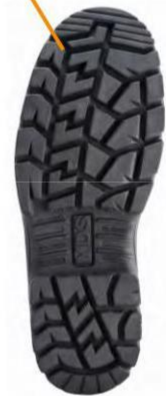
Odlewana, podwójna podeszwa